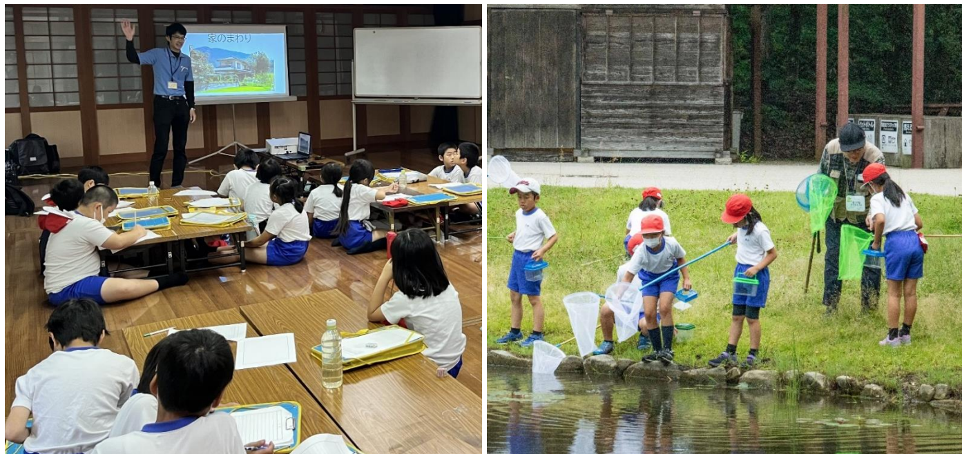
昨年の「第1回 自然観察会」の様子（2023年6月6日撮影）

庄原市立東小学校の課外授業の一環として、6月12日（水）にひばの里において「第1回自然観察会」を開催します。