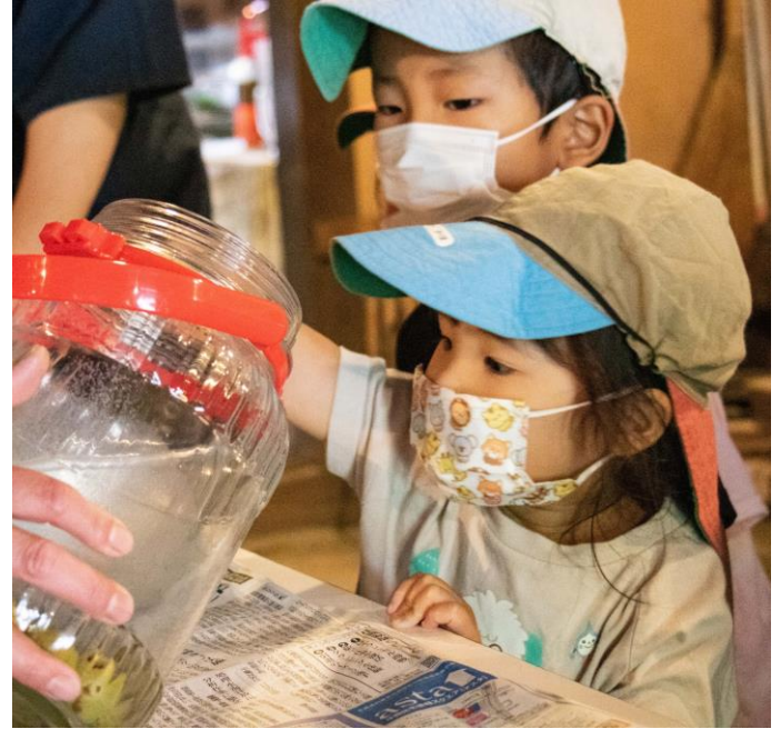
過去の「梅もぎ・梅ジュースづくり」の様子（2022年6月14日撮影）

明治から昭和初期の備北地方の里山の風景を再現した「ひばの里」で、庄原市、三次市内の保育園児に向けた、歴史・伝統文化学習プログラムを開催します。その中で庄原市内の保育園児を6月19日～21日にかけてお迎えして、里山の食文化を学んでいただくことを目的として、「梅もぎ・梅ジュースづくり」を行います。