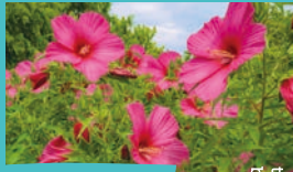
タイタンピカス 7月下旬~9月下旬 みのりの里 第2駐車場付近