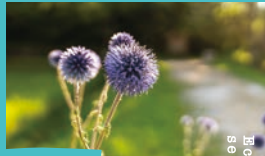
ヒゴタイ 8月中旬~下旬 ひばの里