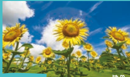
ヒマワリ 8月中旬 みのりの里 ピクニック広場