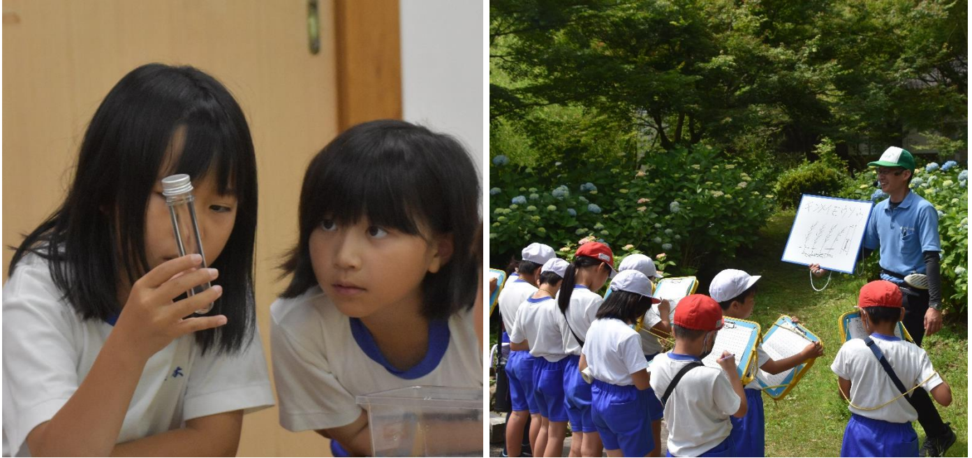
「第1回自然観察会」の様子（2024年6月12日撮影）

庄原市立東小学校の課外授業の一環として、7月17日（水）にひばの里において「第2回自然観察会」を開催します。