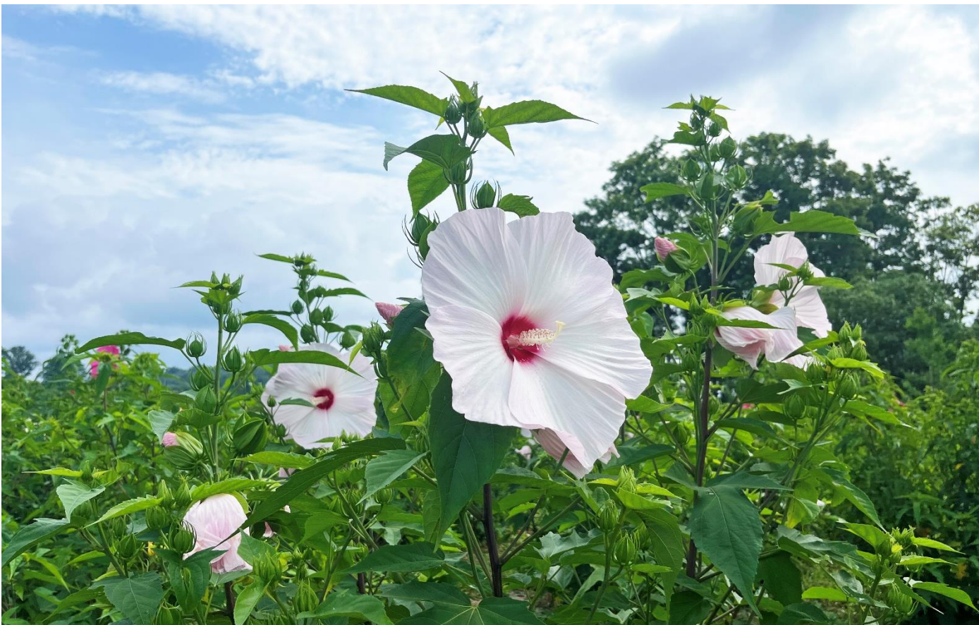
みのりの里 第2駐車場付近「タイタンピカス」の様子（2024年7月17日撮影）

※最新の開花情報は国営備北丘陵公園 HP をご確認ください（ https://www.bihokupark.jp/cgi-hanaiyoho/oview9.cgi ）