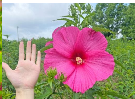
「タイタンビカス」大きさ比較(2024年7月17日撮影)

アメリカフヨウとモミジアオイの交配・ 選抜により誕生した宿根草です。 花の直径は 15~25 cmほどあり、こども の顔くらいの大きさになります。 一日花で毎日代わる代わる咲き続け、 1株で 200 輪近く咲かせます。